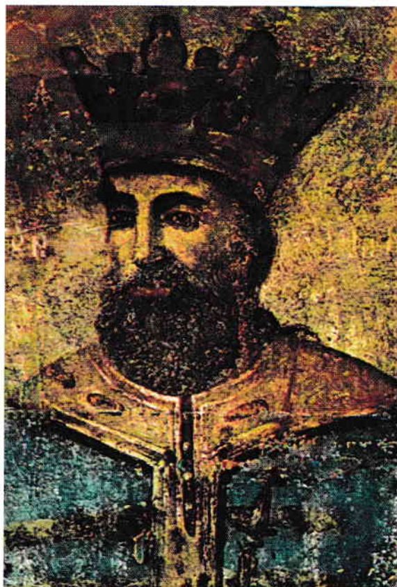
Tabloul votiv al lui Alexandru cel Bun, domn al Moldovei (1400-1432) (Mănăstirea Bistrița)

În plan extern, Alexandru cel Bun a adoptat o politică de bună vecinătate cu vecinii: „A împrumutat Măriei Sale Craiului, ca să-și poarte războaiele cu cruciații, o sumă însemnată de galbeni pentru care a luat amanet ținuturi și cetăți leșești și a făcut scrisorile de închinare după moda medievală către ambii suverani și a domnit într-o legea părinților săi liber și de sine stătător poruncind să-i fie sălașul de veci în Sfânta